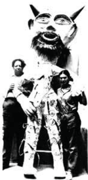
Diego Rivera e Frida Kahlo em San Algel